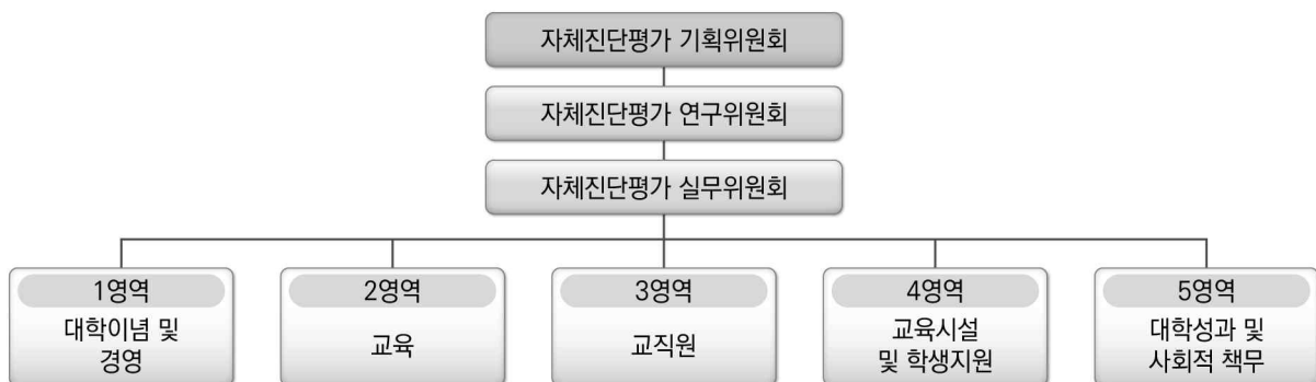
〈그림 1-1〉 자체진단평가 조직 체계도